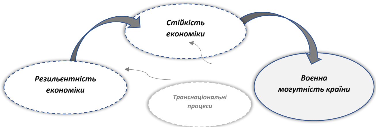
Рисунок 3 – Схематична інтерпретація зв'язку військової могутності країни із резильєнтністю та стійкістю її економіки.

Отже між резильєнтністю, стійкістю та ВМ існує прямий зв'язок (рис. 3).