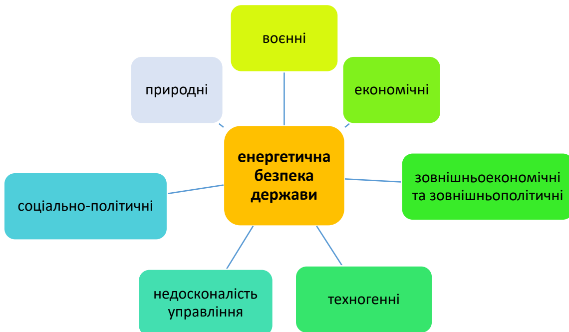
Рисунок 1 – Складові енергетичної безпеки держави

Усі визначені загрози мають безпосереднє відношення до енергокомплексу України.