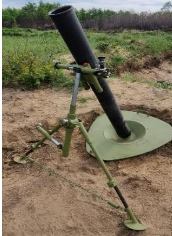
Рисунок 3 – 120 мм міномет НМ-16

Результати стрільби 120 мм пострілом з осколково-фугасною міною М933Д з 120 мм міномету НМ-16 наведено в таблиці 2.